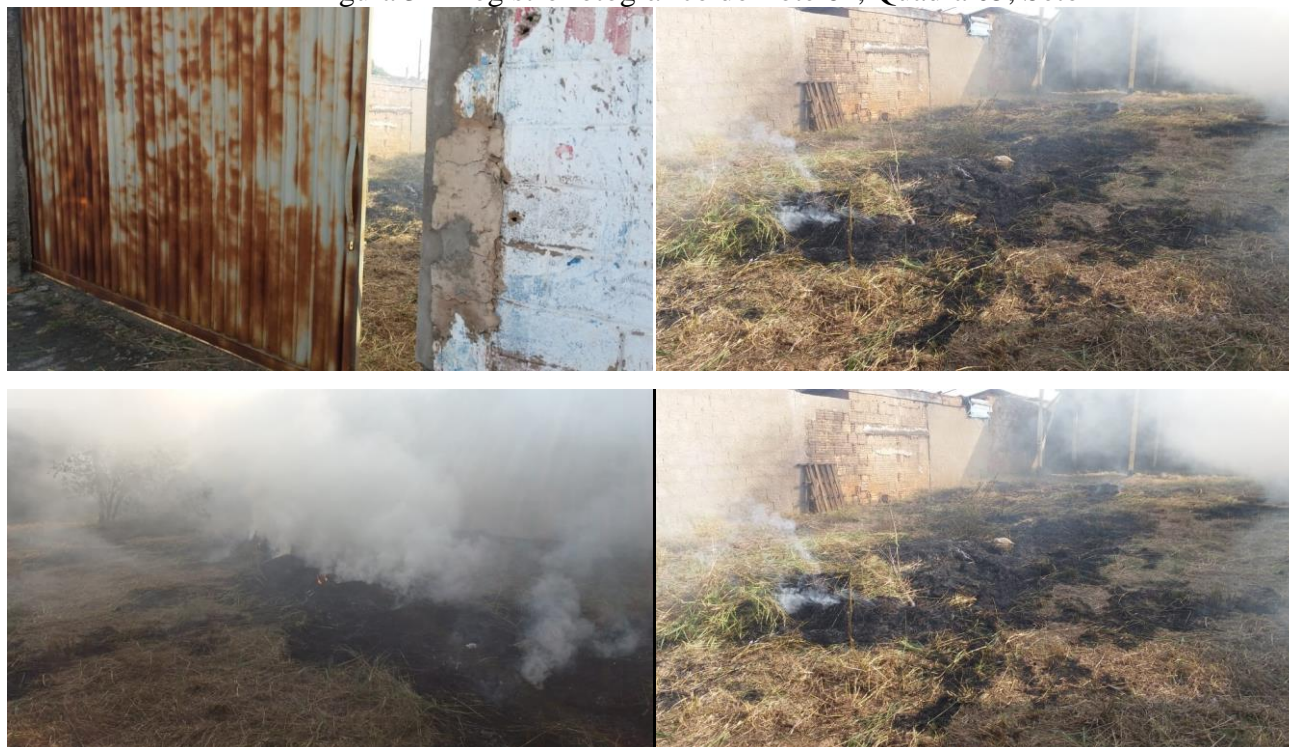
Figura 3 – Registro fotográfico do Lote 64, Quadra 05, Setor 12

O ato da queimada fere a Lei Municipal nº 4905 de 09 de junho de 2017, que veda a realização de queimadas em lotes urbanos no Município de Patrocínio. Por isso, foi lavrado o Auto de Infração nº 000255 que será enviado, via A.R. (Aviso de Recebimento), para a proprietária.