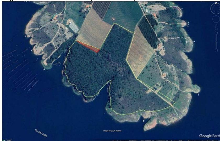
Figura 05: Área de intervenção em destaque vermelho- Corretiva.