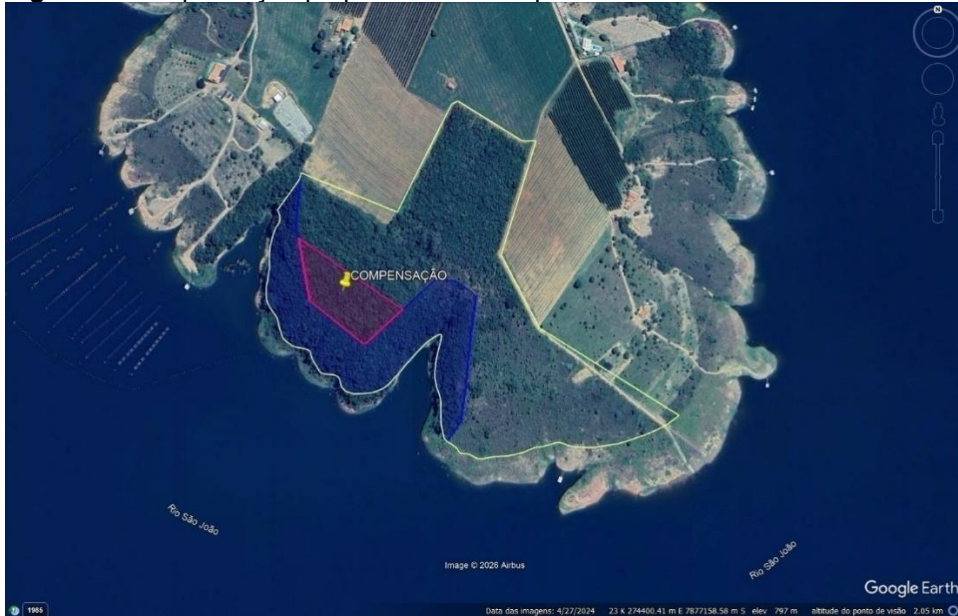
Figura 6: Compensação proposta em destaque rosa.