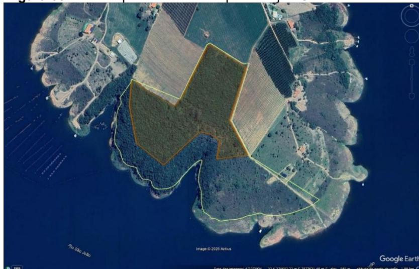
Figura 03: Área requerida em destaque laranja - Cerradão.

Fonte: Google Earth e arquivos kml disponibilizados pela consultoria.