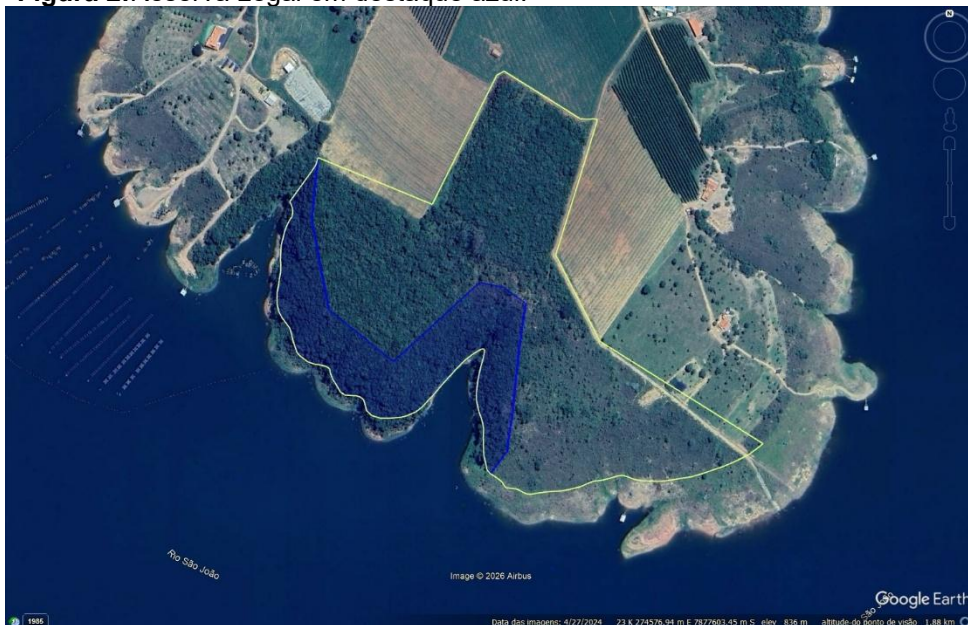
Figura 2: Reserva Legal em destaque azul.

Conforme análise realizada na plataforma IDE-SISEMA, a área destinada à Reserva Legal apresenta cobertura vegetal nativa classificada como Floresta Estacional Semidecidual, encontrando-se atualmente preservada.