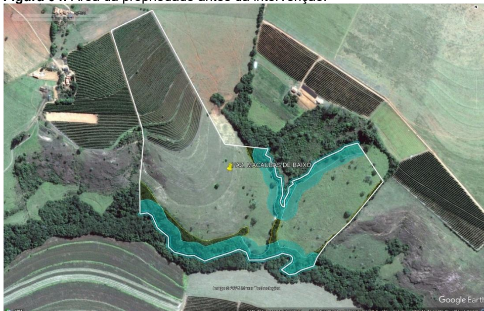
Figura 04: Área da propriedade antes da intervenção.

Nas figuras 04 e 05, tem-se a propriedade antes e após o corte de árvores isoladas.