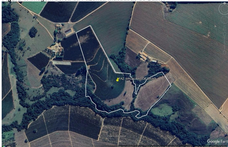
Figura 1: Imagem aérea da Fazenda Macaúbas de Baixo.

O empreendimento Fazenda Macaúbas de Baixo está localizado na zona rural do município de Patrocínio-MG, tendo como pontos de referência as coordenadas planas UTM, zona 23 Sul, DATUM WGS-84 X: 262037.58 m E, Y: 7896221.72 m S. A localização do empreendimento pode ser observada na Figura 1.