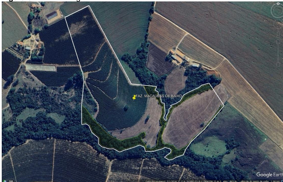
Figura 3: Reserva Legal delimitada em amarelo.