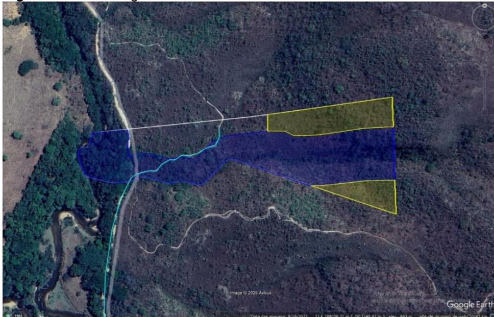
Figura 2: Reserva Legal em amarelo e APP em azul.

Na figura 02 tem-se a delimitação da reserva legal e das áreas de preservação permanente do empreendimento: