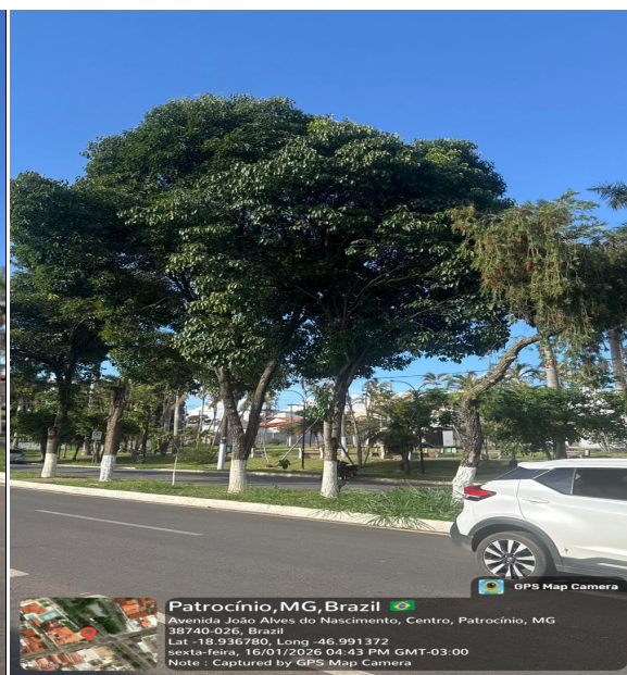
Foto 04: Árvores no C. Central com inclinação irregular quebrados