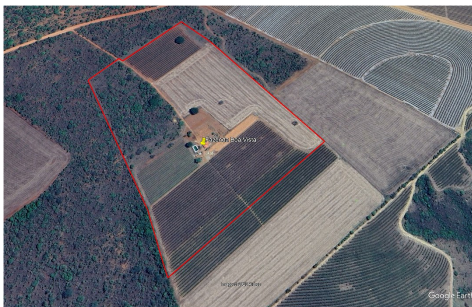
Figura 01: Vista aérea do empreendimento.

O empreendimento Fazenda Boa Vista, matrículas R-12/78.194 e R-64/9.378 está localizada na zona rural do município de Patrocínio-MG, tendo como pontos de referência as coordenadas planas UTM, zona 23 Sul: X:284258.00 mE e Y:7926080.00 mS, DATUM WGS-84 (Figura 01).