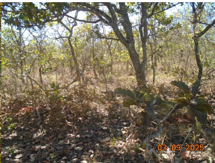
Figura 04 – Reserva legal