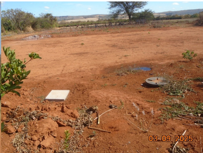
Figura 02 – Fossa séptica - Culturas anuais ao fundo