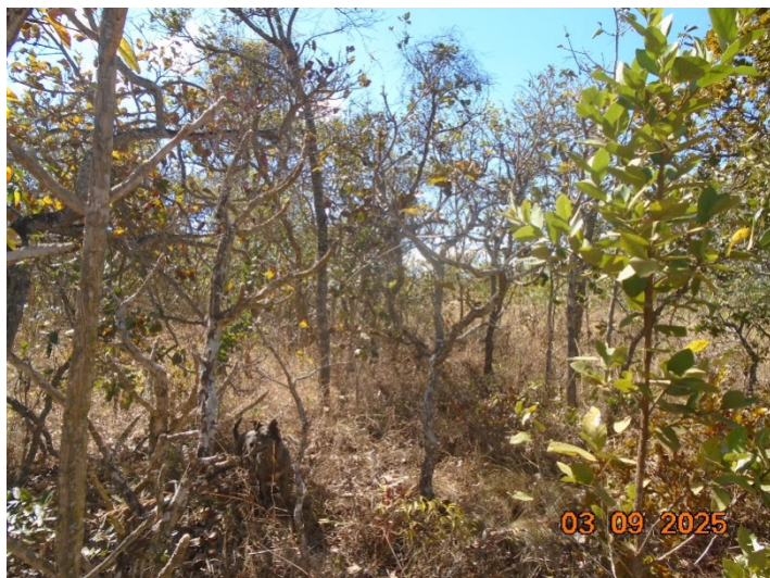
Figura 03 –Reserva legal preservada e conservada