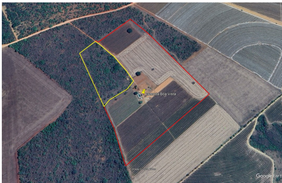
Figura 02: Vermelho: imóvel, Amarelo: reserva legal proposta.