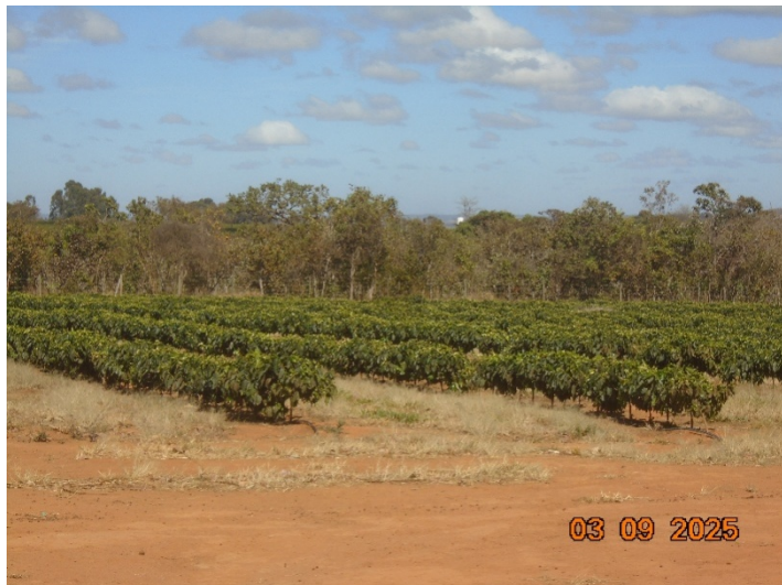
Figura 01 – Culturas anuais – regularização da área