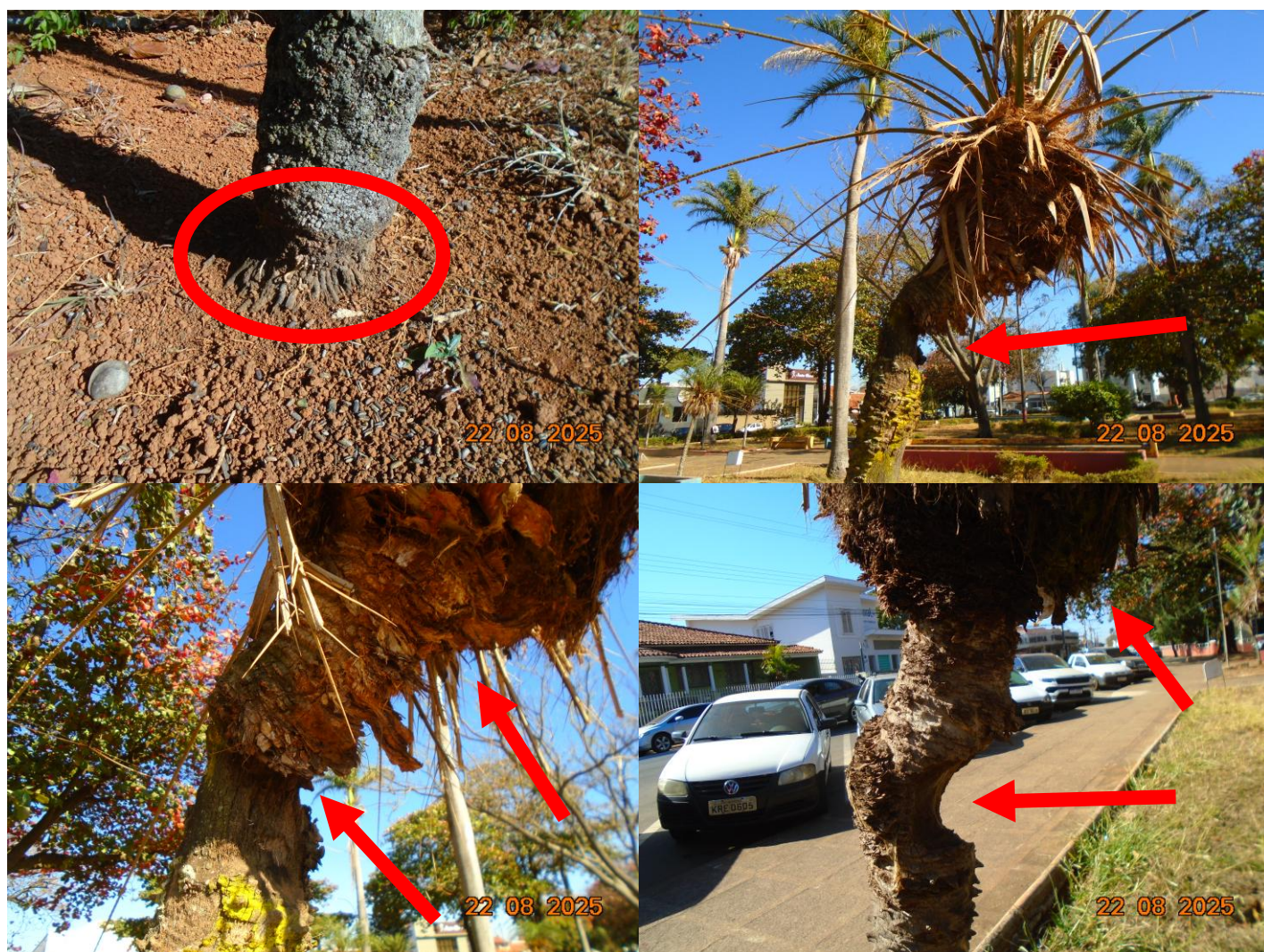
Foto 02: Observa-se exposição de raízes, cavidades e adocimento do tronco e frondes das palmeiras-fênix.