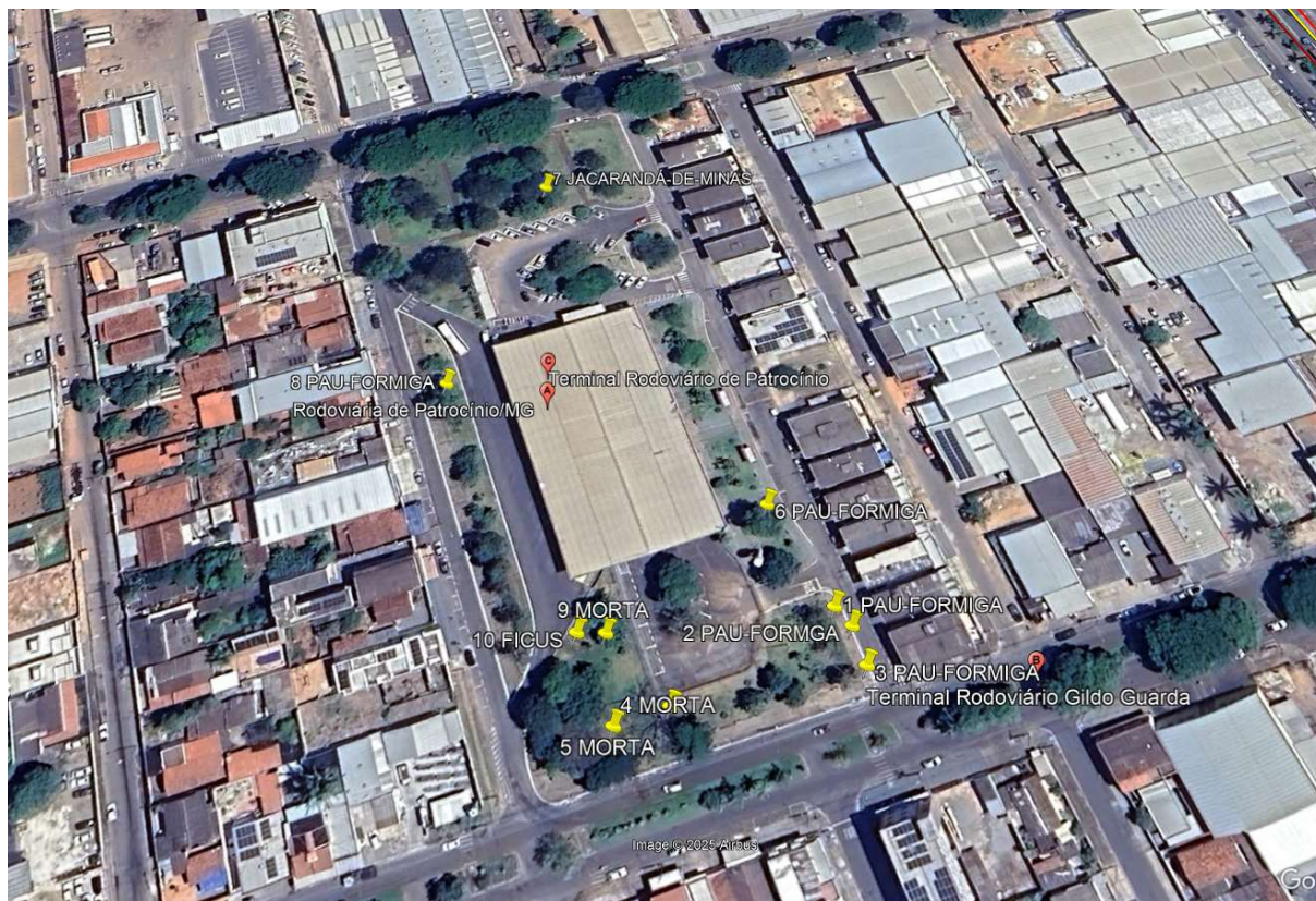
Figura 01: Localização dos indivíduos arbóreos deferidos para poda e supressão.