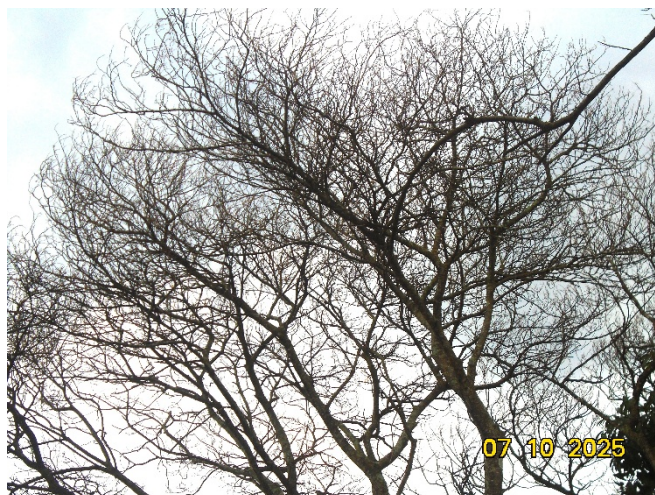
Fotos 14 e 15: Árvore morta, não identificada. Observa-se ausência completa de folhagem, galhos secos e quebradiços.