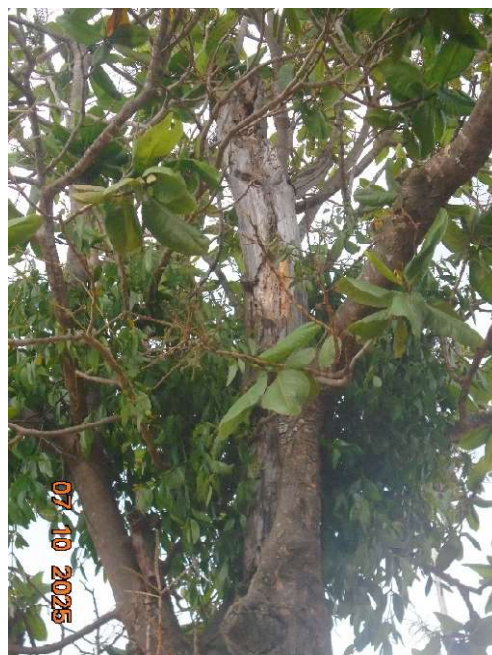
Fotos 04 e 05: Observa-se cavidades e apodrecimento nos indivíduos de Pau-formiga