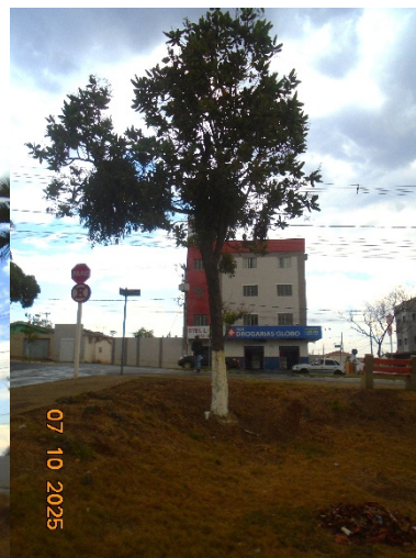
Fotos 01, 02 e 03: Exemplares de Pau-formiga que necessitam de supressão