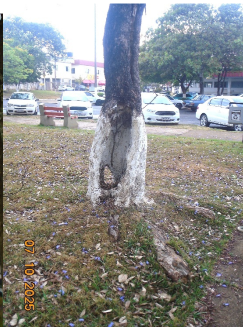
Fotos 08 e 09: Indivíduo de jacarandá-de-minas e imagem demonstrando cavidade e comprometimento do tronco.