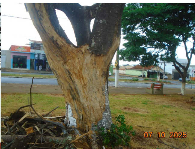
Fotos 11 e 12: Observa-se a ausência de folhagem, presença de galhos secos, quebradiços e descamação do tronco