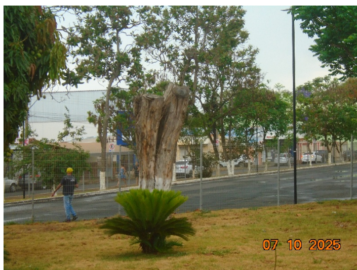
Foto 13: Árvore morta, não identificada. Observa-se que parte superior da árvore já havia sido cortada, ausência de novas ramificações.