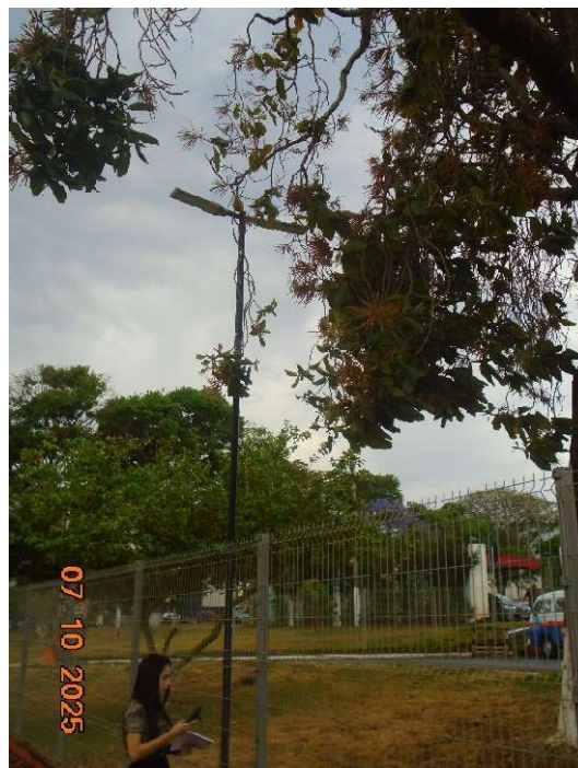
Fotos 06 e 07: Necessidade de poda de adequação. Observa-se galhos estendidos sobre a calçada e proximidade com o poste de iluminação pública.