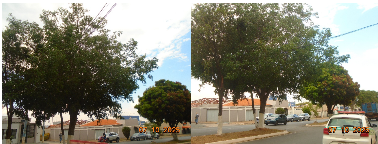
Fotos 01 e 02: Indivíduo arbóreo Ficus. Observa-se copa ampla com galhos estendidos para a rua e em contato com fios.